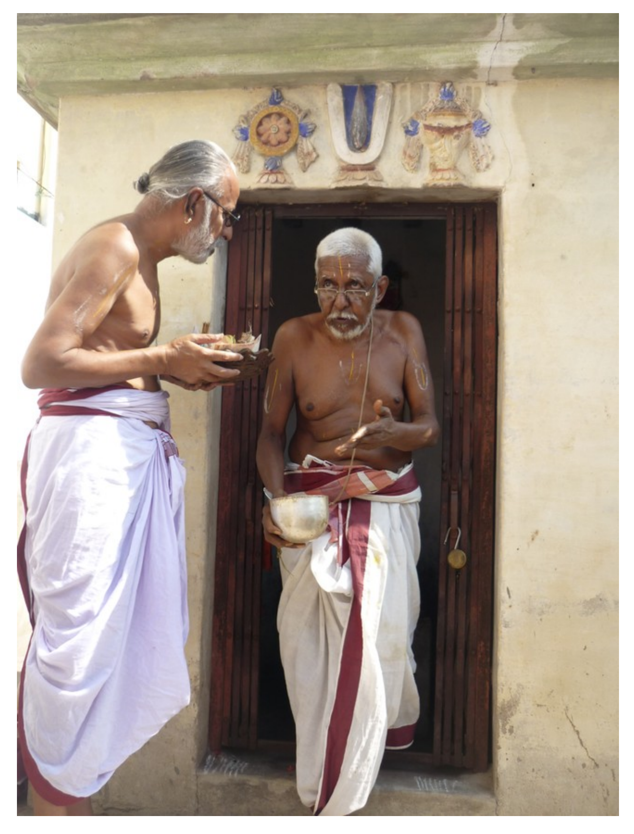
Write-up and photography by Vyjayanthi and Sundararajan