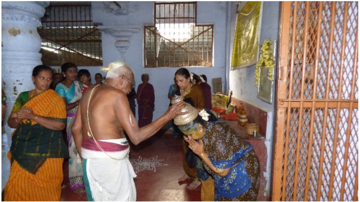
Writeup & Photography : Vyjayanthi and Sundararajan